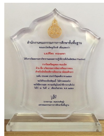
คุณครูศิริพร ครองเคหา ได้รับรางวัลเหรียญทอง ชนะเลิศ ด้านสื่อ นวัตกรรมจัดการเรียนการสอน สำหรับนักเรียนพิการเรียนรวม (มัธยมศึกษา) ระดับประเทศ ประจำปี พ.ศ. ๒๕๕๙