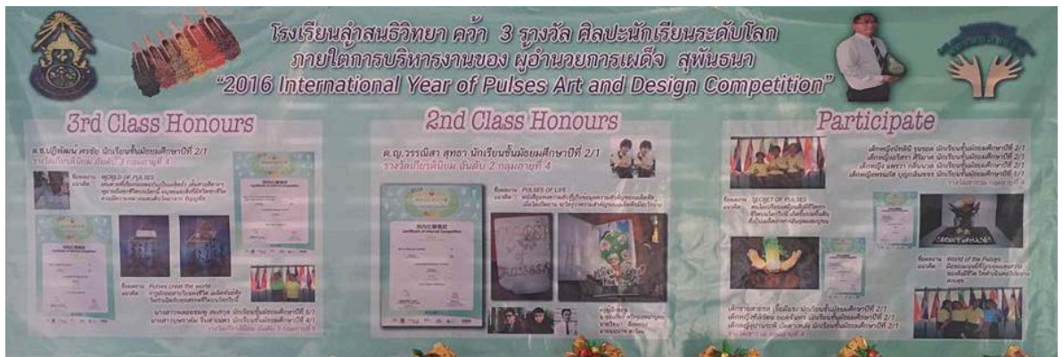
รางวัลศิลปะนักเรียนระดับโลก ปี ๒๐๑๖